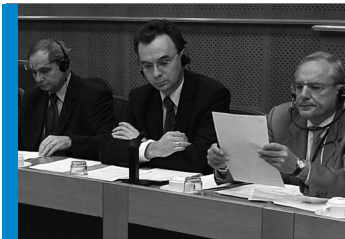
W trakcie prac Parlamentu Europejskiego.

– Tak, albo dla tych przedsiębiorców, którzy mają obniżoną zdolność kredytową i na normalnym rynku komercyjnym jest im trudno otrzymać kredyt. Mają ciekawy pomysł lub inicjatywę, a banki nie chcą ryzykować.