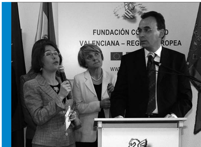
Otwarcie biura Wielkopolskiego Ośrodka Kształtowania i Studiów Samorządowych w Brukseli (czerwiec 2005 r.).

– Istnieją jednak pewne furtki. Przedsiębiorstwo może np. nabyć bardzo nowoczesne oprogramowanie komputerowe. Jednak projekt, który będzie ubiegać się o dofinansowanie w ramach programu krajowego, musi być wart przynajmniej dwa miliony euro. Narzędzia informatyczne są bardzo pomocne i potrzebne w zarządzaniu firmą, ale mam wrażenie, że będą tańsze niż graniczna minimalna kwota. Część ekspertów uważa, że byłoby znacznie korzystniej, gdyby innowacyjność była szerzej rozumiana, aniżeli tylko w aspekcie technologiczno-technicznym.